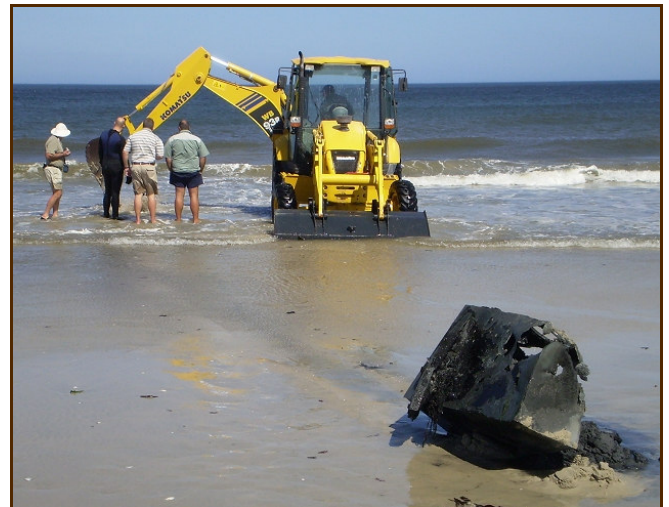
Rocherpan, op de voorgrond het metalen object

In maart 2006 hadden we weliswaar aangetoond dat het mogelijk is met een aerial survey metaal te detecteren in de bodem, maar vanwege beperkte tijd en middelen waren we niet in de gelegenheid om dit te identificeren. Met hulp van de lokale Historische Vereniging Velddrif konden we zwaar materieel in de vorm van een graafmachine op het strand laten komen om ter plaatse bij laagtij in de brandingszone op te graven.