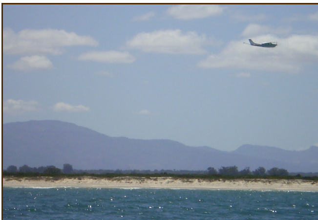
Aerial survey bij Wamakersvlei, St. Helenabaai

In navolging van de eerdere aerial survey van 2006, die langs de kust plaatsvond over een afstand van veertig kilometer, besloten we ditmaal om een kleiner gebied meer zeewaarts te laten verkennen. In overleg kwamen we tot een gebied van tien vierkante kilometer ter hoogte van Wamakersvlei, de meest waarschijnlijke omgeving van de landingsplaats van Daniël Sillemans en de zes andere overlevenden van De Gouden Buys.