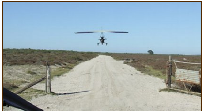
Landing bij Dwarskersbos, St. Helenabaai

plekken op de zandbodem, die eventueel zou kunnen duiden op een wrak. De strandlopers op hun beurt hadden de gelegenheid om vanaf het strand verder dan normaal de branding in te lopen op zoek naar boven het zand uitstekend hout of andere zaken.